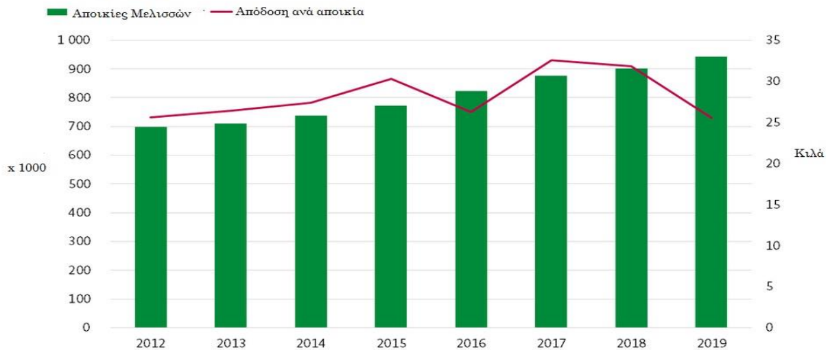
Γράφημα 2: Αποικίες μελισσών στη Γερμανία και απόδοση ανά αποικία

Αναφορικά με τις προδιαγραφές κυκλοφορίας μελιού στην αγορά της Γερμανίας, είτε πρόκειται για εγχώρια παραγωγή, είτε για εισαγόμενα προϊόντα, η τελευταία έχει εναρμονιστεί πλήρως με το ευρωπαϊκό θεσμικό πλαίσιο, όπως αυτό αποτυπώνεται στην «Ευρωπαϊκή Οδηγία 2001/110/ΕΚ του Συμβουλίου της 20ης Δεκεμβρίου 2001 για το Μέλι», εκδίδοντας μίας σειρά διαταγμάτων και νόμων.